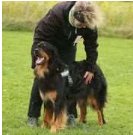
Zur Ruhe bringen

Mit der richtigen Kommunikation gelang auch die Akzeptanz von Autoritätssignalen und das Befolgen von Regeln: