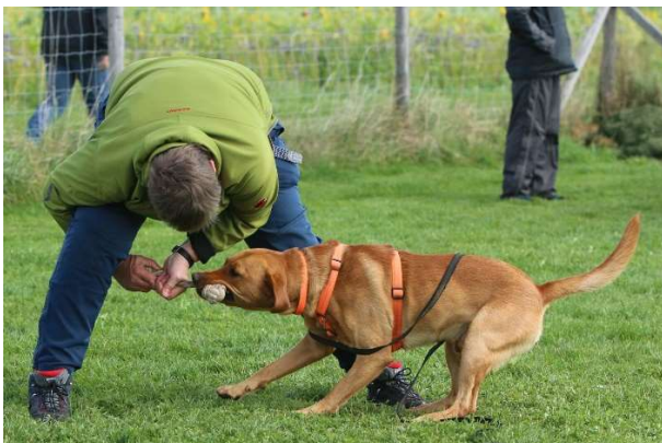
Spielen mit Objekt

Ein zentrales Element beim praktischen Training in Kleingruppen (unter der Anleitung der angereisten CreaCanis-Trainer) bildete das engagierte Spielen mit dem Hund – mit und ohne Objekt. Die Teams lernten ihren vierbeinigen Partner zu aktivieren und danach auch wieder Gelassenheit und Ruhe zu vermitteln.