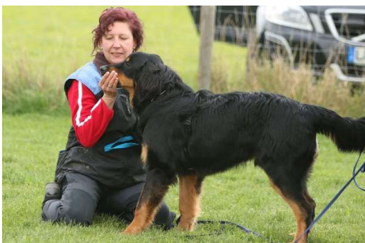
Und wieder abgeben