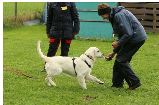
Freigabe auf Signal