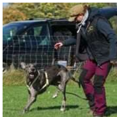
Spielen ohne Objekt