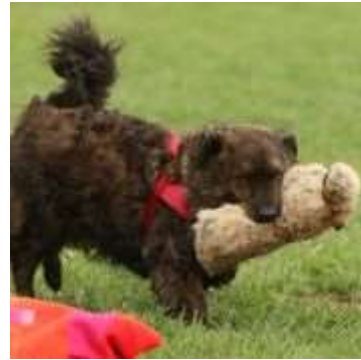
dann geht's los