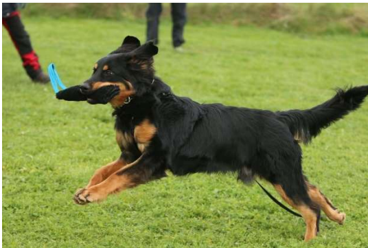
Apportieren kann ja so viel Spaß machen!