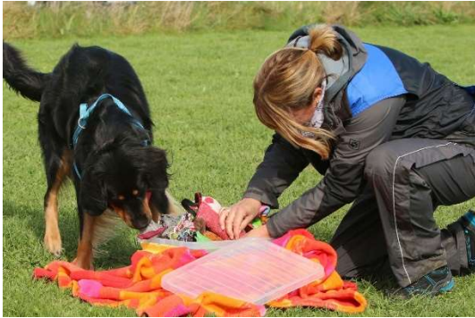
Zuerst das richtige Spielzeug aussuchen

Zum Abschluss der Seminartage durften die Mensch-Hunde-Teams beim Apportieren zeigen, was sie gelernt hatten: