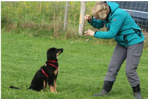
Abwarten und Impulskontrolle

Mit der richtigen Kommunikation gelang auch die Akzeptanz von Autoritätssignalen und das Befolgen von Regeln: