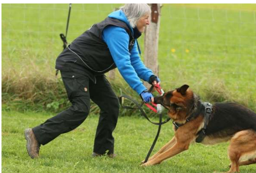
Um eine Beute streiten